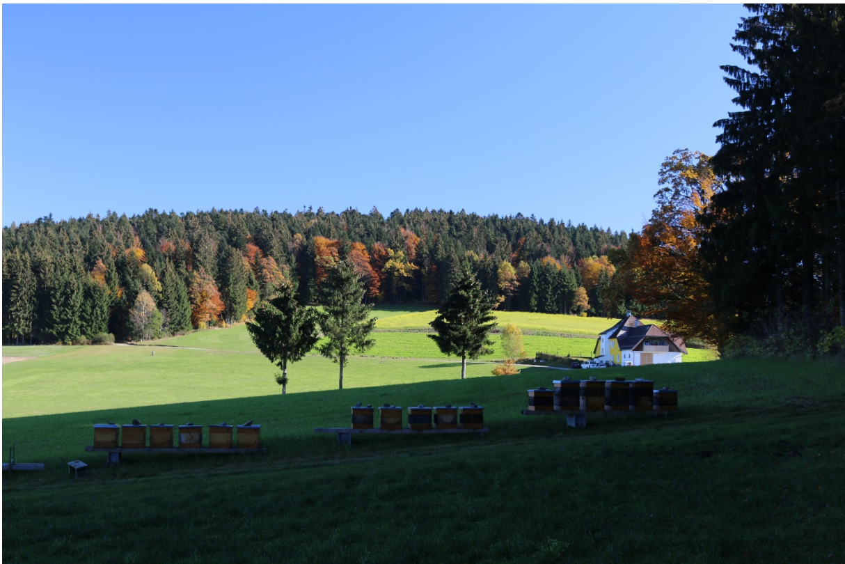
Bild 2: Bienenstand mit ca. 200 Meter entferntem blühenden Senf. 31.10.2015; 13.45 Uhr: 12° C im Schatten am Bienenstand; 16° C im Senffeld. Kühle windige Ostwetterlage. 670 Meter Seehöhe.

*Anmerkung: Als "Tracht" bezeichnet der Imker die Summe des Nahrungsangebotes für die Honigbienen. Also Nektar, Pollen, Honigtau. Dementsprechend gibt es eine Differenzierung in Pollentracht, Nektartracht, und Honigtautracht. Und auf die Pflanzenart bezogen: eine Rapstracht, Akazientracht, Löwenzahntracht u.v.m.