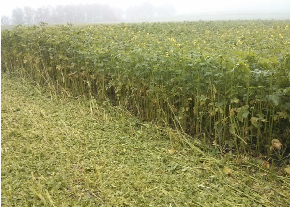
Bild 8 und 9: Rechtzeitiges Häckseln vor der Blüte (Senf). Zeitig am Morgen, ohne Bienenflug. 4.11.2015