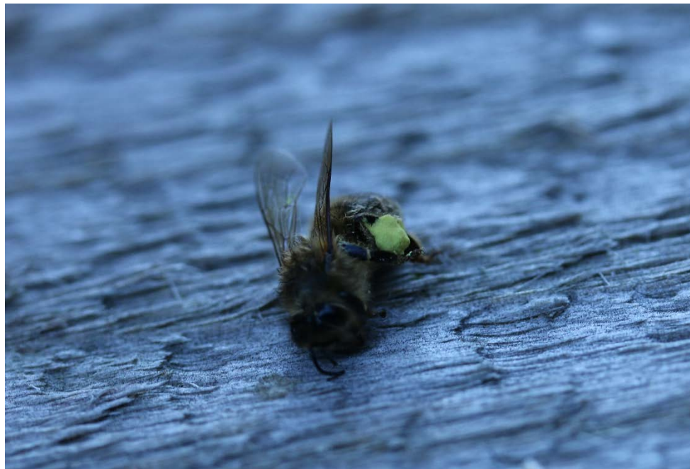
Bild 5: Auf der Holzstafel des Bienenstandes „notgelandete“ Trachtbiene mit Pollen. Am Vortag im kalten Ostwind erstarbt und eingegangen. Fotografiert am 31. 10.2015. 10.50 Uhr.

Eine weitere Gefahr sind die im Oktober und November oft für die Flugbienen grenzwertigen Temperaturverhältnisse . Während im Winter (in warmen Schönwetterperioden) und im zeitigen Frühjahr die Grenztemperatur für die Flugtätigkeit bei 9 bis 10°C liegt, liegt diese im Sommer und Herbst bei erfahrungsgemäß 12 bis 13°C. Kalte Winde schränken den Flugbetrieb meist zusätzlich ein. Wenn im Spätherbst bei wärmerem Schönwetter allerdings einmal eine ergiebige Futterquelle (z.B. blühender Senf) gefunden wurde, dann versuchen die darauf eingeflogenen Bienen diese auch an Tagen mit Grenztemperaturen anzufliegen. Die Bienen sind vor allem bei der Heimkehr vom Trachtflug gefährdet, wenn sie durch das Pollensammeln und das Heimfliegen bei kühlen Temperaturen erschöpft sind. Dann erreichen sie noch den Bienenstand, setzen sich aber oft erschöpft am Dach oder an der Wand des Bienenstockes nieder. Fliegen sie nicht sofort wieder auf, kühlen sie rasch aus, erstarren und sterben schließlich mit ihren Pollenhöschchen an den Hinterbeinen ab. So kann es bei kritisch niedrigen Temperaturen und/oder kalten Winden (kontinentale Ostwetterlage!) durch spät blühende Zwischenfrüchte auch zu nicht unbeträchtlichen Bienenverlusten kommen.