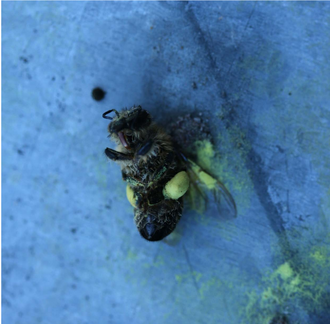
Bild 6: Auf dem Blechdach des Bienenstockes „notgelandete“ Trachtbiene mit Pollen. Am Vortag im kalten Ostwind erstarrt und eingegangen. Fotografiert am 31. 10.2015. 10.50 Uhr.

Der Varroamilbe steht mit der (eigentlich nicht geplanten) Fortdauer der Bruttätigkeit eine längere Phase für die eigene Vermehrung zur Verfügung. Da mit der sogenannten Restentmilbung durch den Imker im November/Dezember nie 100 Prozent erfasst werden können, bleibt, durch die länger andauernde Vermehrungszeit für die Varroamilbe, zwangsweise eine größere Milbenzahl als "Restmilben" übrig. Diese bilden die Startpopulation im kommenden Frühjahr. Die Höhe dieser Startpopulation ist maßgeblich dafür verantwortlich, wie rasch bzw. wann die Milbenzahl im Sommer eine für das Bienenvolk kritische Größe erreichen wird. Unter ungünstigen Bedingungen, wie langes Brüten in den Herbst hinein und eine nur kurze brutfreie Phase durch einen milden Winter, kann sich die Milbe so stark vermehren (exponentielle Entwicklung), dass bereits Ende Juli die ersten